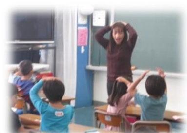
<低学年の授業の様子>

私は、子供たちの英語の良い基礎をつくり、会話をする自信を後押しすることを目標として、ALTとしてこの学校で英語を教えています。その目標は実現するのでしょうか。もちろん、します。子供たちの学ぶ意欲、先生方の大きな助けと支えがあれば、この目標は達成できるでしょう。なので、私は有意義で盛り多い新年度を楽しみにしています。