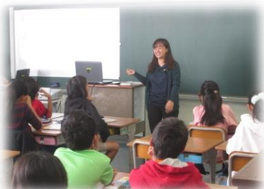
<高学年の授業の様子>