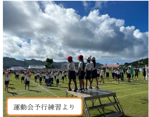
運動会予行練習より

10月1日は、第56回小中高連合運動会です。記録を遡ると、令和元年度は従来の連合運動会を実施していました。令和2年度は新型コロナウイルス感染症対策のため連合運動会を行わず、小学校は「体育発表会」を行いました。令和3年度は感染症対策のため規模を縮小し、連合運動会を実施。令和4年度は感染症対策と改築工事が進む中での運動会になりました。令和5年度も昨年同様の規模で実施します。この先、校庭に仮校舎が設置される関係で、この芝生の校庭で小中高連合運動会ができるのもあとわずかとなりそうです。小学生、中学生、高校生が小中学校の校庭に集まるので「島っ子」の成長して